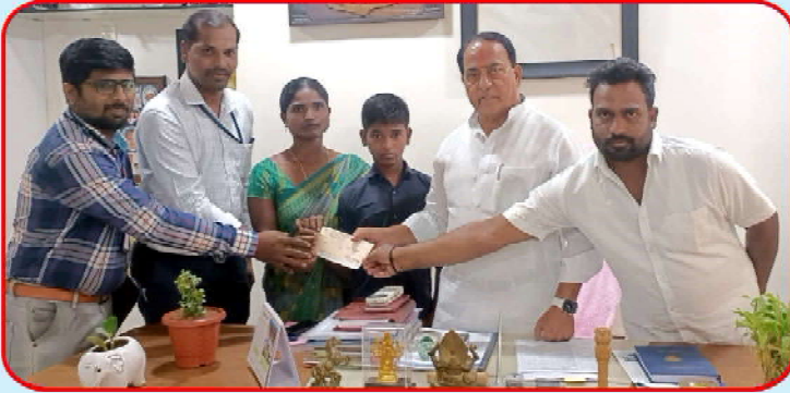
Claim Cheque distributed by Sri Allola Indrakaran Reddy garu Honorable Minister for Endowment & Forest to the family members of deceased account holder of Nirmal Branch.